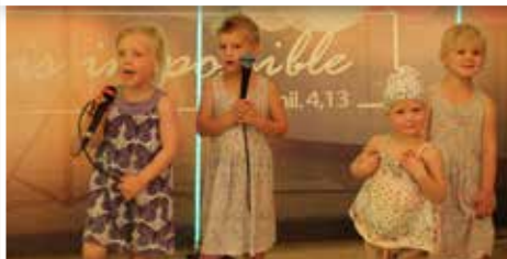
Kinder - Gegenwart und Zukunft