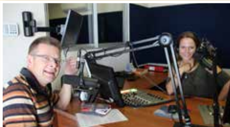
Tägliche Rundfunkandachten: Landesweit zu hören über zwei Radiostationen