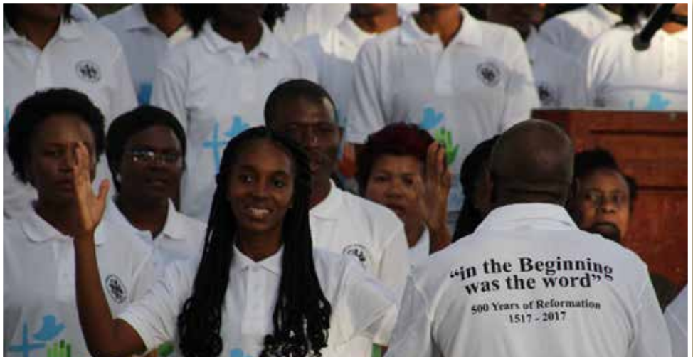
2. Juni 2016 - der Startschuss ist gefallen - Auftaksveranstaltung („launch“)

durch das Erstellen von Publikationen u.a. von Material für den Kindergottesdienst und Konfirmandenunterricht mit dem Schwerpunkt „Reformation“; aber auch durch gezielte Präsenz in den Medien, wie ein Radioquiz - bei dem in drei Sendungen über Luther und die Reformation informiert wurde. Auch eine Publikation für Erwachsene ist erschienen, die über verschiedene Aspekte berichtet, wie die Reformation sich auf dieses Land und seine Menschen ausgewirkt hat. Das Postamt hat eine Sonderbriefmarke für diesen Anlass herausgegeben. An ganz vielen Stellen wurden Helfer aus den örtlichen Gemeinden herangezogen - etwa auch als Musiker in den verschiedenen Chören. So soll dieses internationale Event auch seine namibische Farbe bekommen. Soweit möglich, wurden hiesige Künstler, Anbieter und Firmen herangezogen, damit auch die