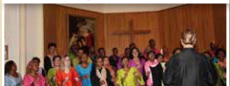
Christuskirche - für alle!