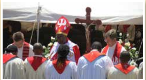
UCC - NELC Kirchengemeinschaft

Allein durch weitere Spenden - die ELKIN (DELK) ist eine Freiwilligkeitskirche - werden seit Jahren, zusätzlich zum normalen Haushalt, zwei Kinder- und Jugenddiakone finanziert. Die Betreuungsschwerpunkte liegen in den großen Gemeinden Windhoek und Swakopmund, auch deshalb, weil sich viele der deutschsprachigen Farmkinder hier in den Schülerheimen befinden. Das „Kinder- und Jugendnetzwerk“ ist eine riesengroße Erfolgsgeschichte und macht den Gemeindegliedern große Hoffnung, dass die Kirche eine Zukunft im Land hat. In Zeiten, in denen in Deutschland der Abbau von Pfarrstellen beklagt wird, hat man den Glaubensmut gefunden, einen gegenteiligen Weg zu gehen. Beflügelt durch den Erfolg, soll in Otjiwarongo eine dritte Kin-